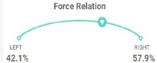
Force Relation in Newtons