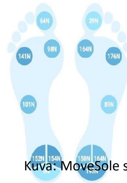
Kuva: MoveSole sovellus