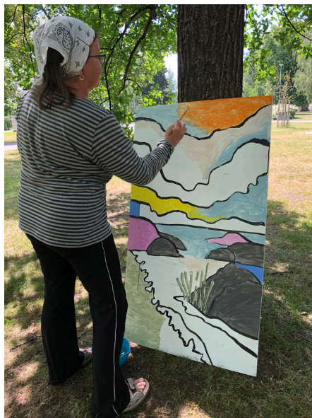
Suomen suurin värityskirja.