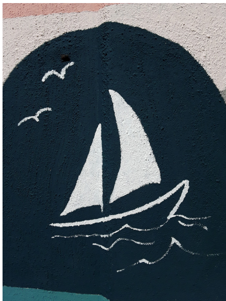
Pujevene osana muraalia.