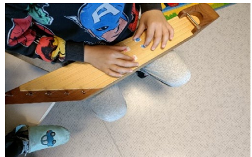
Musiikkihetki Gerbyn päiväkodilla Vaasassa.