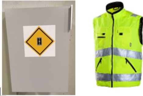
Kuva 2 Turvakaappi ja huomioliivi

Poistumiskäske kiinteistöstä voi tulla palokellojen hälytyksenä tai huutaen tai keskusradion kautta suoritettuna hälytyksenä. Kokoontumispaikka ulkona on Raatihuoneen rappu.