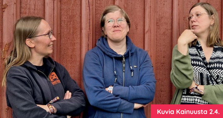
Kuvia Kainuusta 2.4.