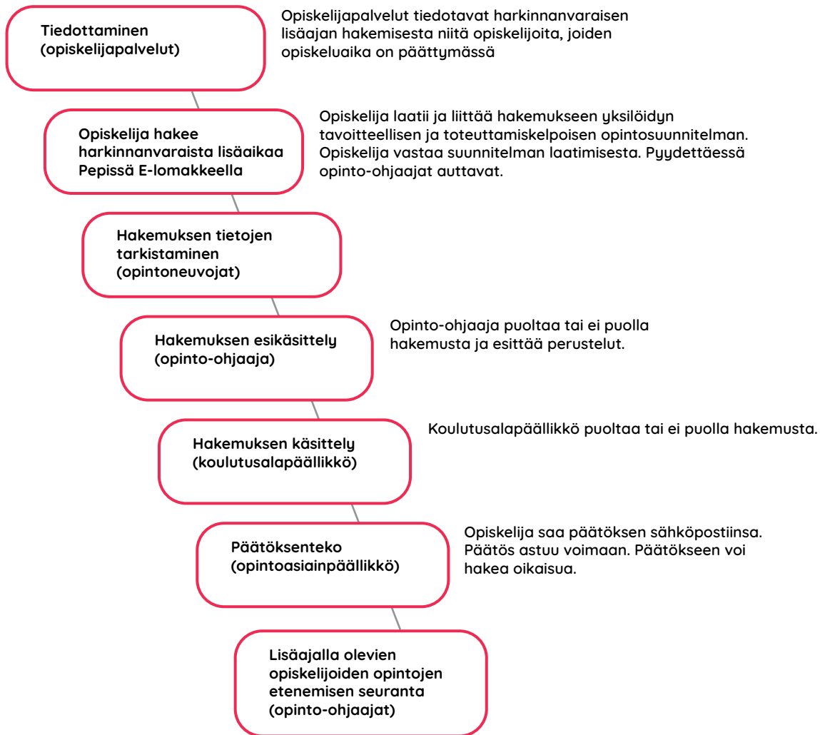
KUVIO 2. Harkinnanvaraista lisäaikaa hakevien opiskelijoiden ohjausprosessi ja opintojen seuranta.

tarjolla olevia tukipalveluja (Skills Centria ja opinto-ohjaus) tarpeen vaatiessa. Opinto-ohjaajan tehtäviin kuuluu yhteydenpito harkinnanvaraisella lisäajalla opiskelemaan opiskelijaan ja hänen opintojensa seuranta. Yhteisenä tavoitteena on opiskelijan ohjaaminen kohti tavoitettua kintoa. Kuviossa 2. kuvataan ohjausprosessi.